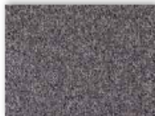
99 4m + 5m