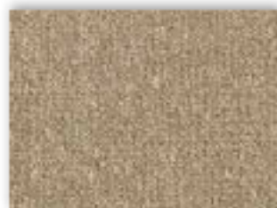
31 4m + 5m