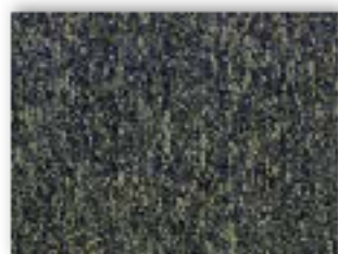
29 4m + 5m