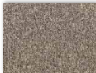
49 4m + 5m