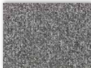
94 4m + 5m