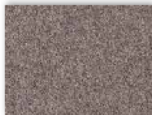
92 4m + 5m