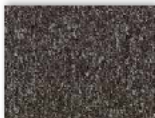
95 4m + 5m