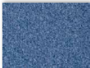
77 4m + 5m