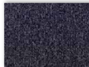
96 4m + 5m