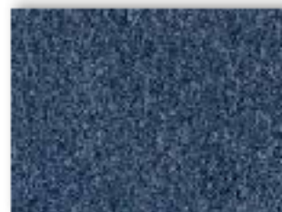
79 4m + 5m

La couleur illustrée: Veuillez ne révéler le nom de couleur les caractéristiques de ce produit tout en conservant les mêmes qualités techniques. Il est fortement conseillé d'utiliser les codes couleur et les codes pour les pièces séparées individuelles.